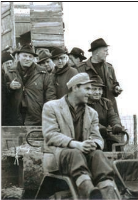
Unten: Treiber werden zur Jagd gebracht und Strecke wird aufgelegt.