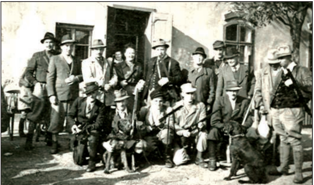
Unten: Jagdgesellschaft beim Siebenjochhof (Elisabethhof).