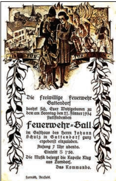
Links und rechts unten: Balleinladungen der Feuerwehr Gattendorf aus 1934 und 1948.