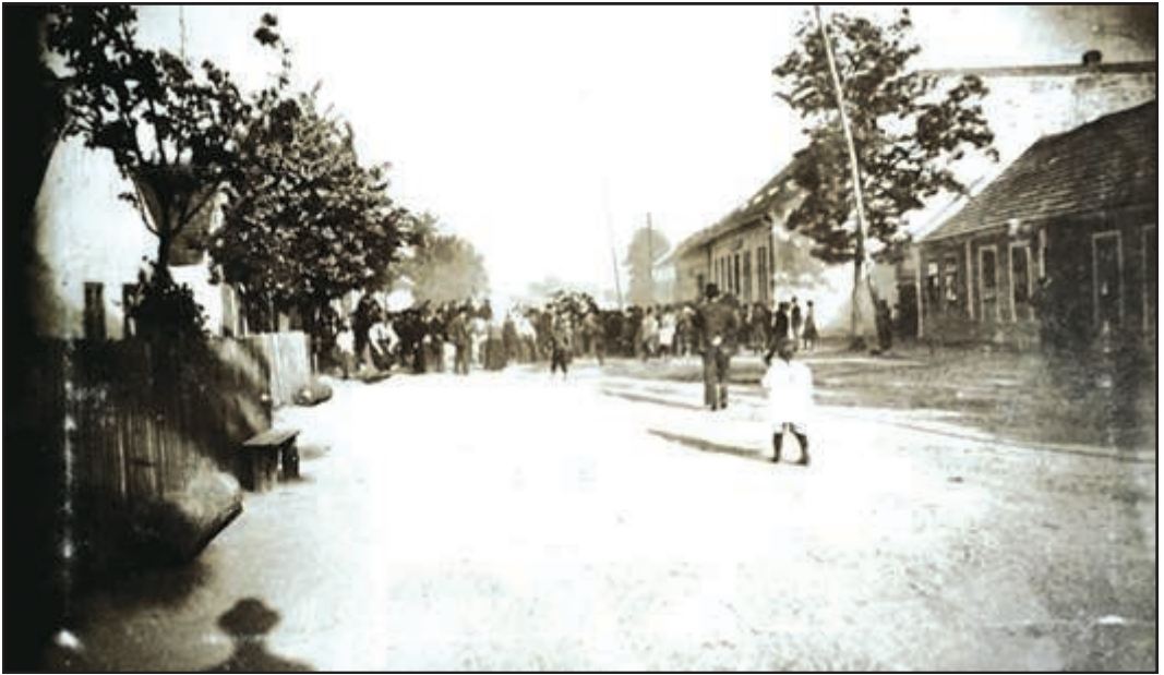
Oben: Maibaum wird vor dem Gemeindegasthaus aufgestellt. Rechts zurückgesetzt ist das spätere Gasthaus Limbeck in der Unteren Dorfstraße, danach Gemeindeamt und Gemeindegasthaus.