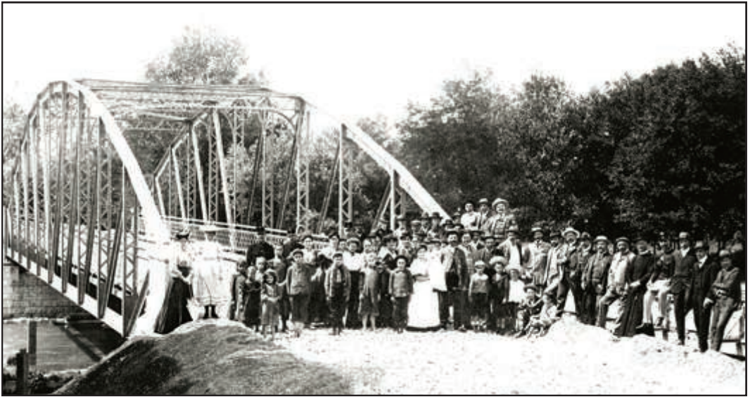
Bild oben: Blick von der Mühle zur neuen Leithabrücke, die im 2. Weltkrieg zerstört wurde. Der 5. von rechts ist Pfarrer und Dechant Paul Levay.