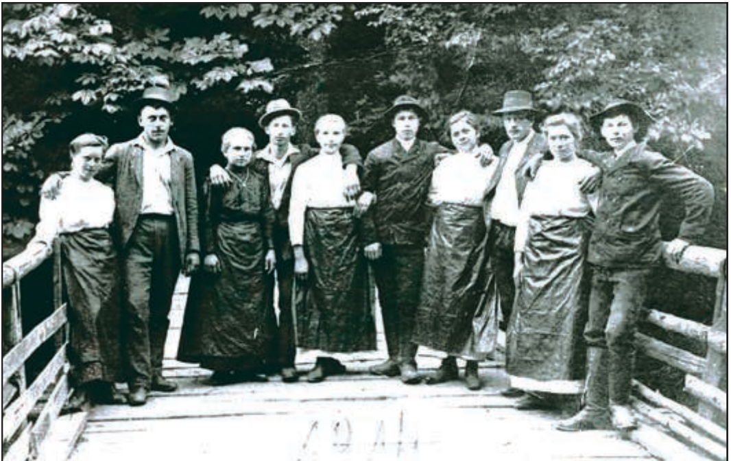
Unten: Gattendorfer Jugend 1914 auf der Leithabrücke im Park.