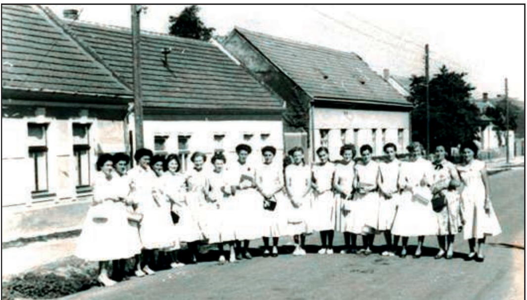
Unten: Gattendorfer Mädchen im Sonntagsstaat. Im Hintergrund die Häuser Kreminger (HNr. 26), Kreminger (HNr. 27) und Thüringer (HNr. 28) in der Unteren Dorfstraße.