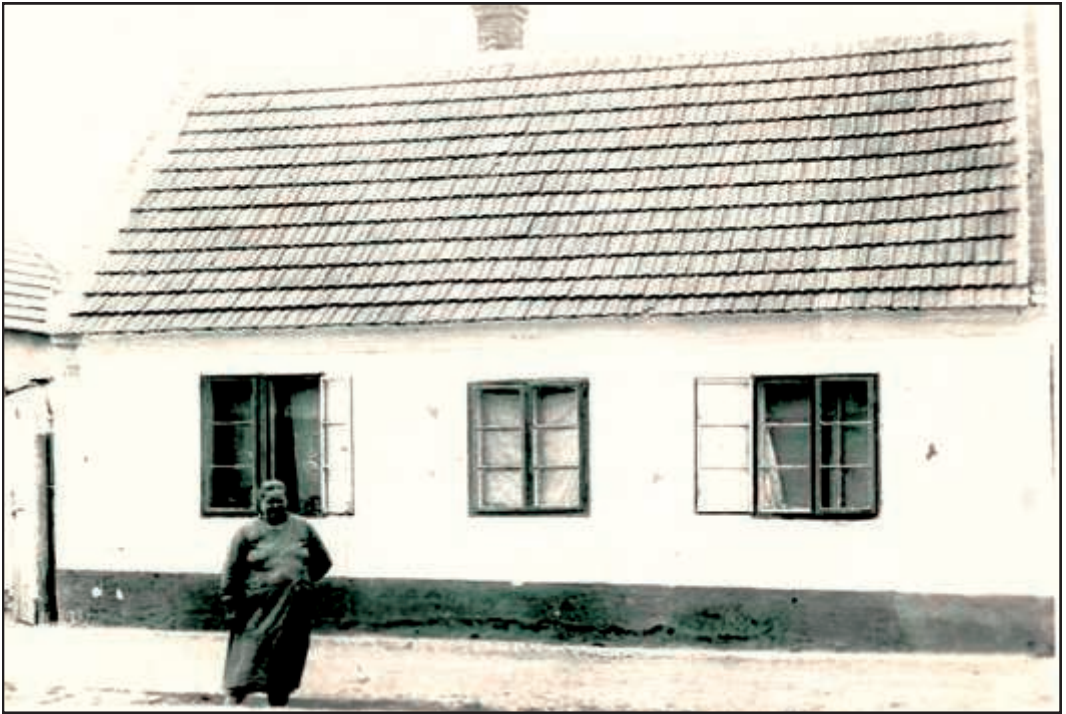
Oben: Varga Theresia vor ihrem Haus