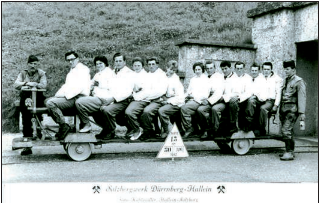
Ausflug in das Salzbergwerk Dürrnberg - Hallein am 30. Juni 1962