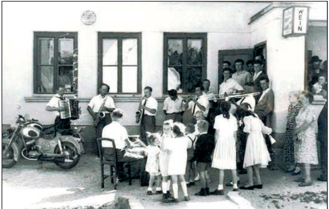
Unten: Musikkapelle vor dem Gasthaus Limbeck